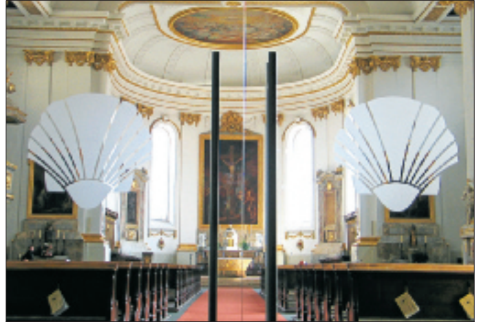
Der Patron ist allgegenwärtig: Jakobsmuscheln in den Glastüren der Stiftskirche