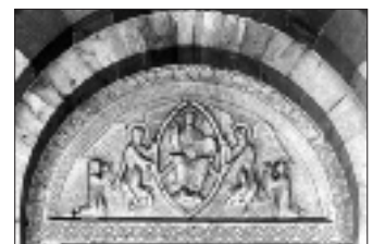
Hauptportal des Klosters Alpirsbach. Die Person ganz links soll den Klosterstifter Adalbert von Zollern zeigen.